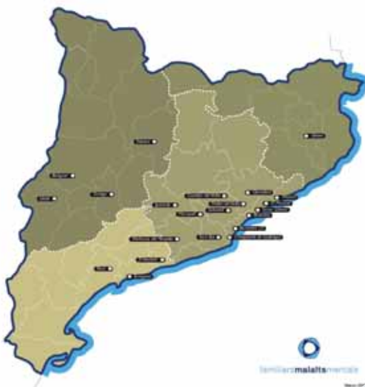
Distribución territorial de los Clubes sociales

En el año 2005 FECAFAMM encargó un estudio titulado "Evaluación técnica de los Clubes sociales para personas con trastorno mental" a la Universitat de Lleida cuyo objetivo era evaluar si este recurso respondía adecuadamente a las necesidades de las personas con enfermedad mental y si podía ser considerado como servicio susceptible de constituir una prestación del sistema de servicios sociales. Este estudio, que avala el recurso como una herramienta eficaz, deriva posteriormente a una redefinición del modelo de Club Social para dotarlo de un marco teórico y metodológico más eficiente, llevado a cabo por FECAFAMM, Forum Salut Mental y el Departamento de Acción Social y Ciudadanía, y que tiene como repercusión directa que en la vigente Ley de Servicios Sociales del año 2007 se contemplen los Clubes Sociales como un nuevo servicio de cartera.