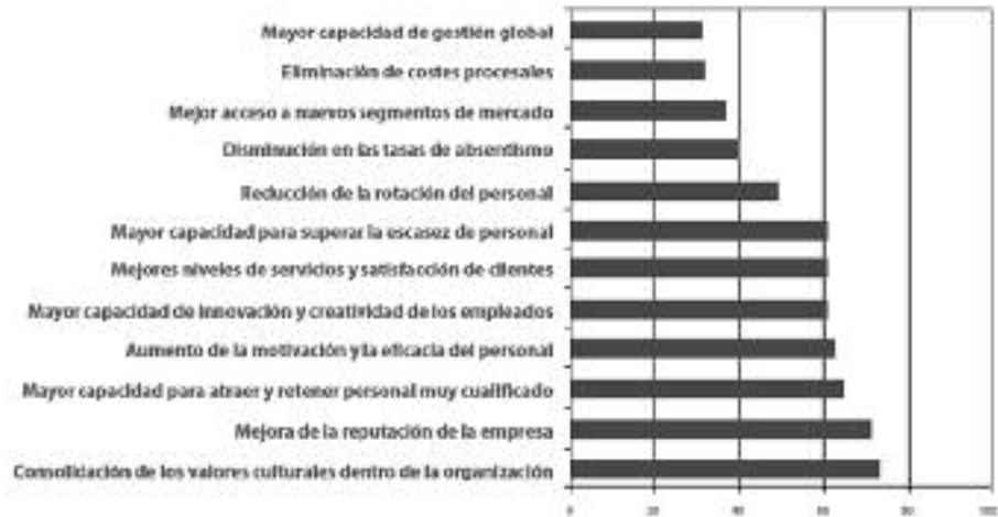
FIGURA 6 EMPRESAS QUE ESTÁN APLICANDO POLÍTICAS DE DIVERSIDAD. BENEFICIOS OBTENIDOS (PORCENTAJE DE EMPRESAS QUE CALIFICARON LOS BENEFICIOS COMO IMPORTANTES O MUY IMPORTANTES)