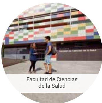
Facultad de Ciencias de la Salud

Promoción de la formación a lo largo de la vida.