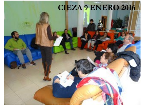
CIEZA 9 ENERO 2016

Agradecemos el interés por aprender y seguir mejorando la calidad de los servicios que ofrecemos a las personas con enfermedad mental en todos los puntos de la Región.