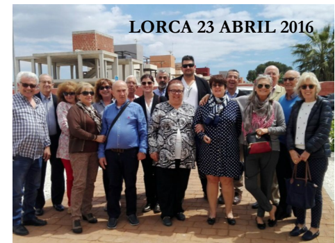
LORCA 23 ABRIL 2016