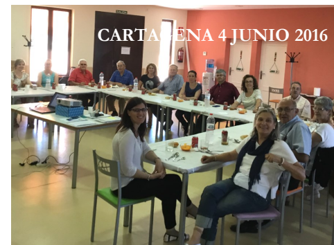
CARTAGENA 4 JUNIO 2016