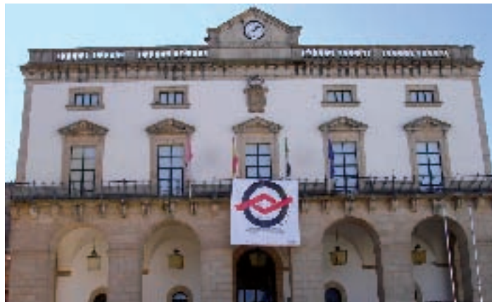
Ayuntamiento de Cáceres, que refleja la gran labor de FEAFES - Cáceres