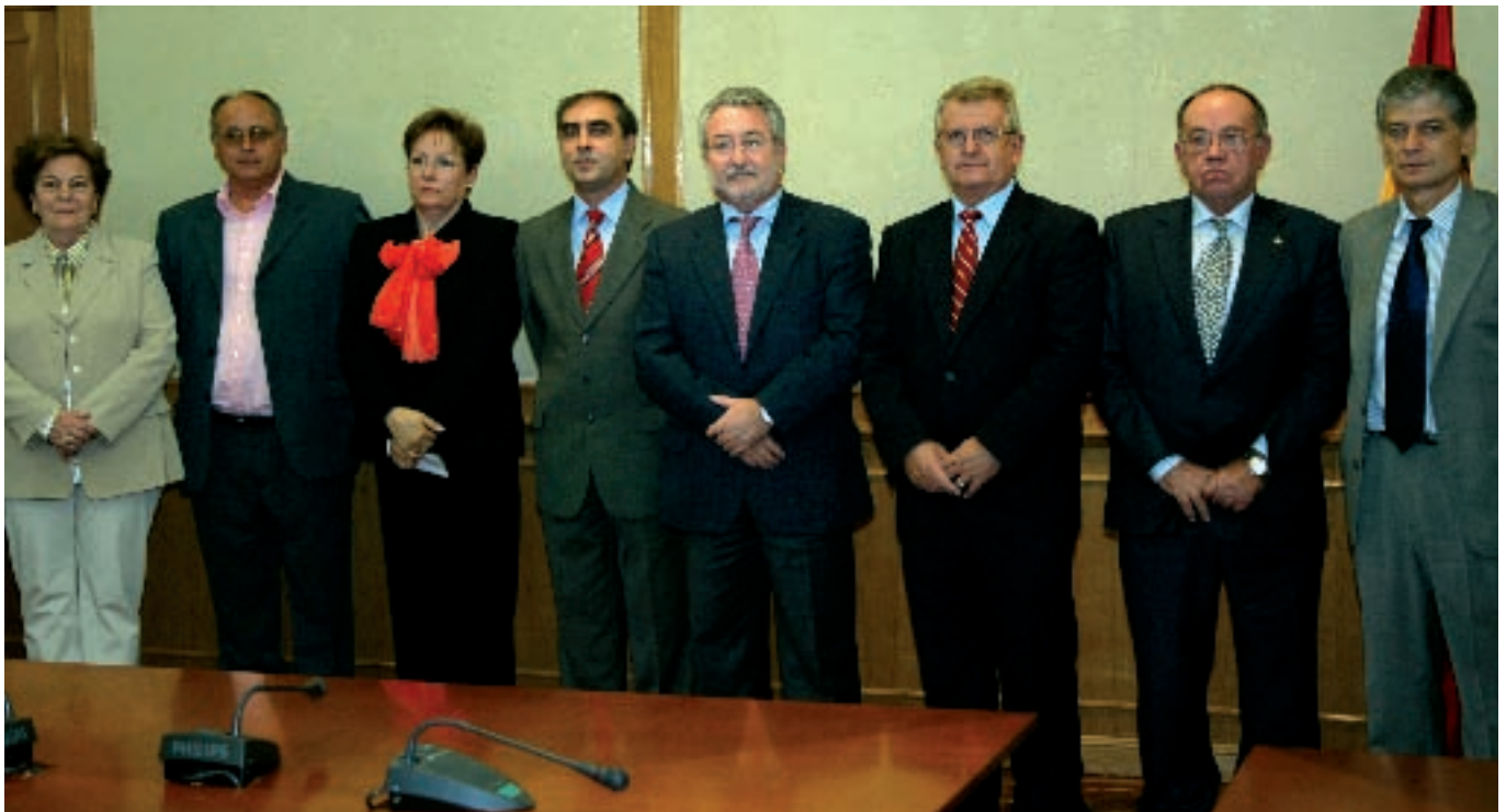
Miembros de la Junta Directiva de FEAFES con los representantes del Ministerio y el Presidente de FEAFES

Por su parte, Soria explicó a FEAFES las medidas que se han adoptado desde el Gobierno para dar respuesta a las necesidades de las personas con enfermedad mental y de sus familias. Señaló el desarrollo de la Estrategia en Salud Mental, aprobada en diciembre de 2006 en la que FEAFES participó activamente. Resaltando los aspectos clave de la misma: la promoción de la salud mental, la prevención de la enfermedad mental, la erradicación del estigma, la atención a los trastornos mentales, coordinación inter e intrainstitucional, la formación del personal sanitario, la investigación en salud mental y la mejora de los sistemas de información.